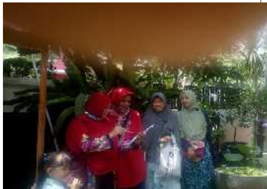
Foto Bersama dengan KetuaFKDS Kota Depok dalam acara Rapat kerja di Kecamatan

Mendata hasil pemeriksaan Jumntik Di rumah tangga oleh Kader Dasa Wisma