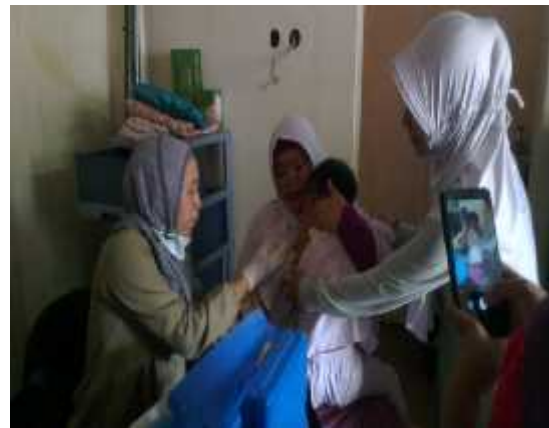
Foto Bersama dalam rangka Penilaian Akreditasi Puskesmas