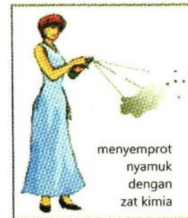
menyemprot nyamuk dengan zat kimia

2. Memelihara ikan pemakan jentik nyamuk.