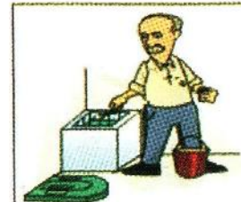
menaburkan serbuk abate

1. Membunuh jentik nyamuk demam berdarah di tempat air yang sulit dikuras atau sulit dengan menaburkan bubuk temephos (abate) atau altosid 2-3 bulan sekali dengan takaran 1 gram abate untuk 10 liter air. Abate dapat di peroleh atau di beli di puskesmas atau apotik.