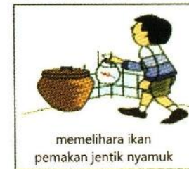
memelihara ikan pemakan jentik nyamuk

5. Memasang kawat kasa pada jendela dan ventilasi.